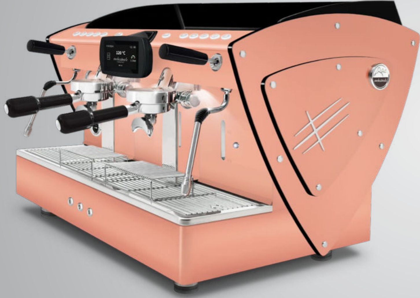
Toute blanche methacrylate noir