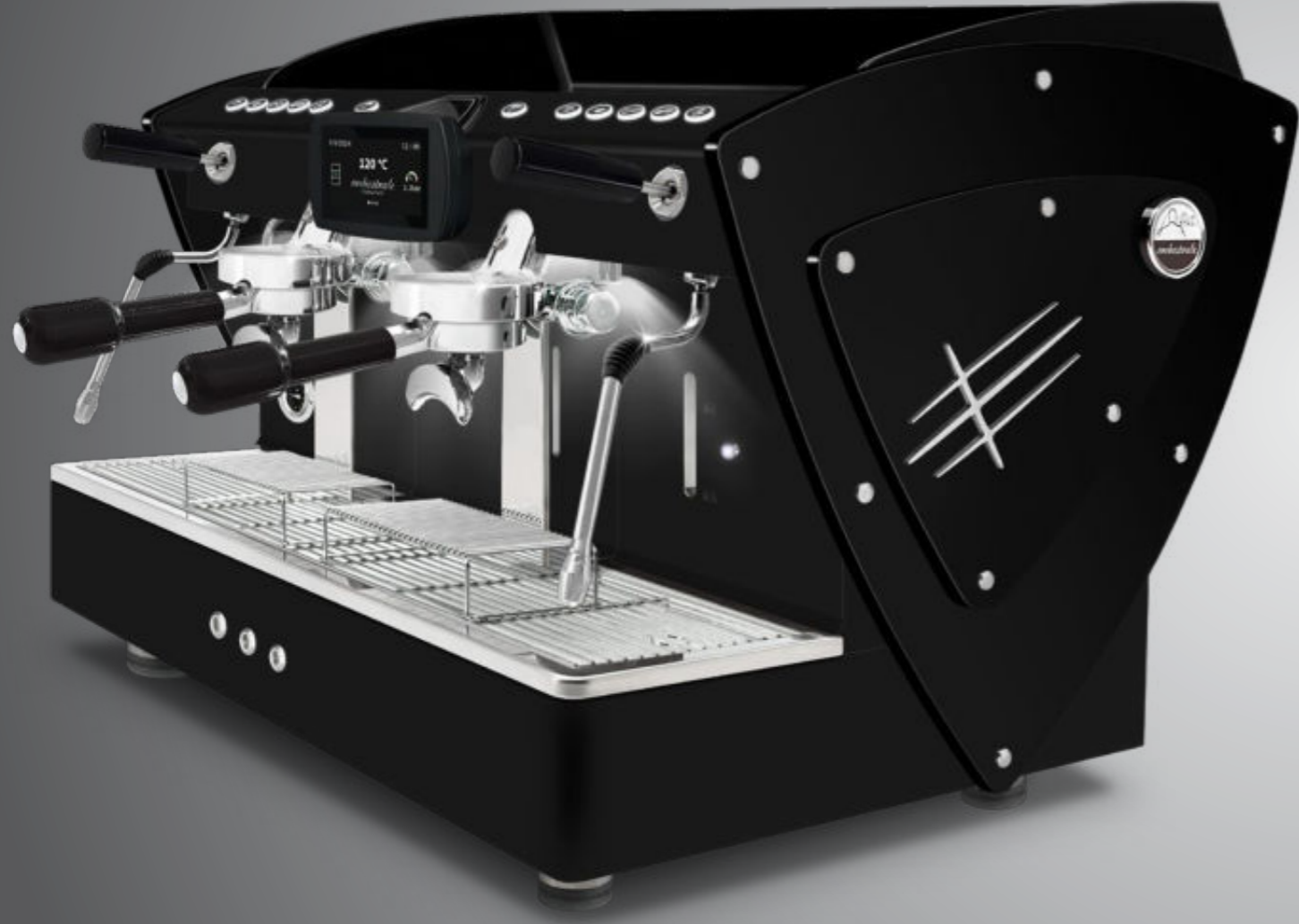
Toute noire methacrylate noir