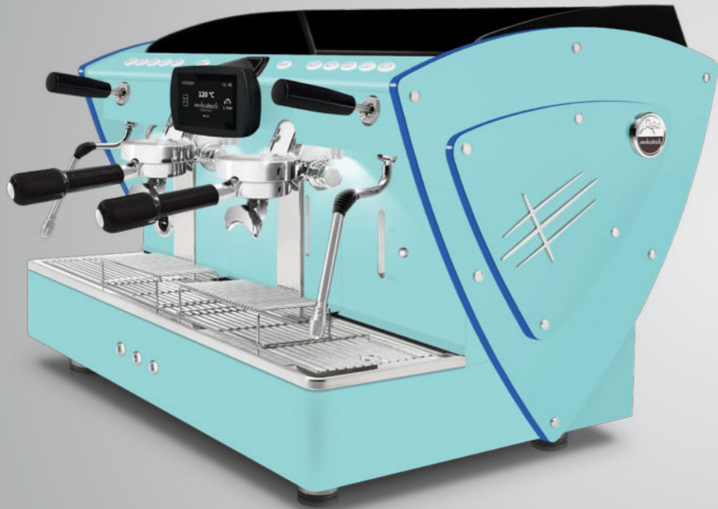
Toute bleu Tiffany methacrylate bleu