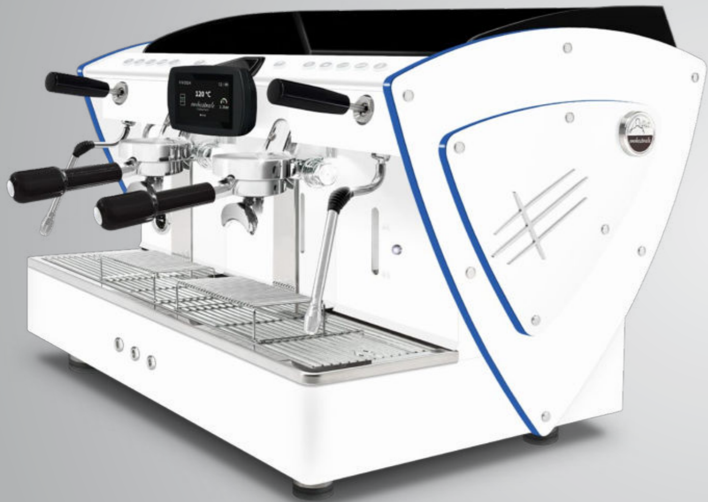
Toute blanche methacrylate bleu