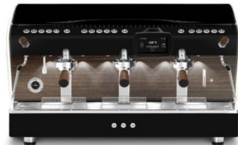
3gr Automatique PID Écran tactile full optional