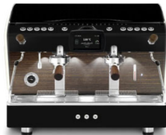
2gr Automatique PID Écran tactile full optional