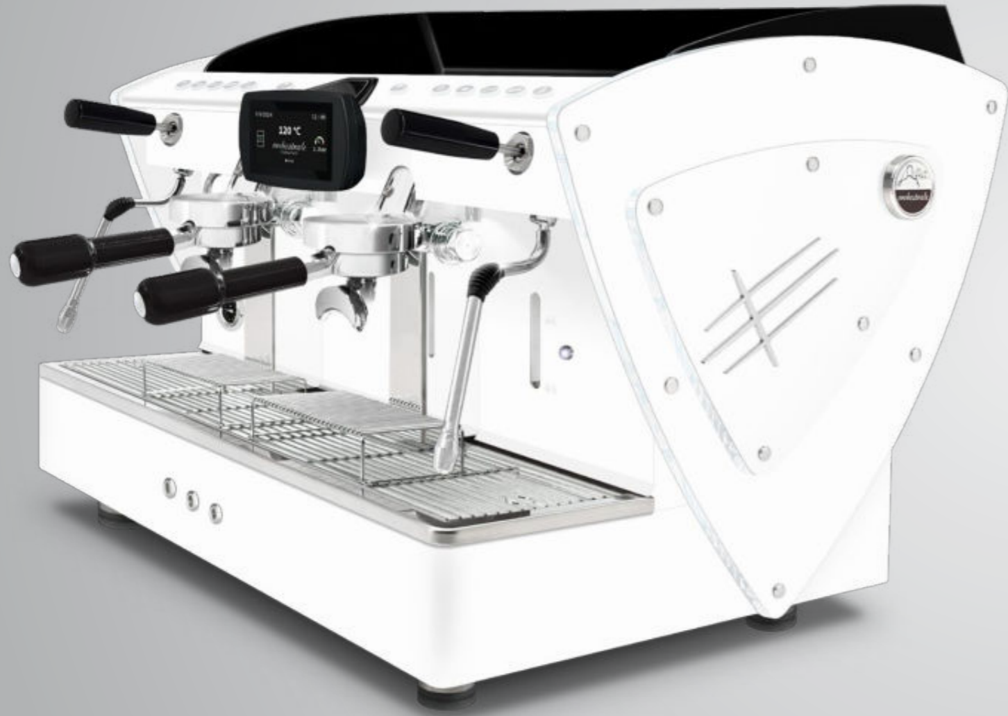
Toute blanche methacrylate transparent