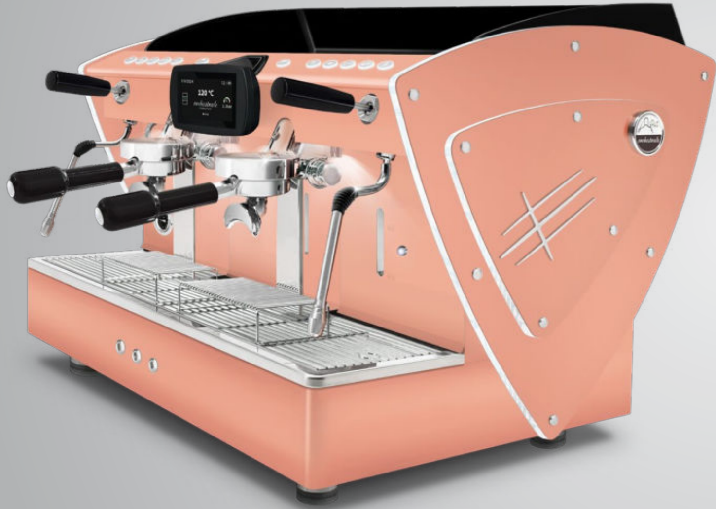
Toute blanche methacrylate transparent