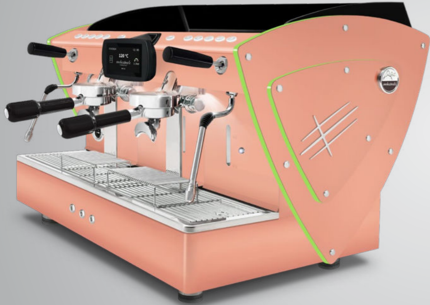
Toute blanche methacrylate vert