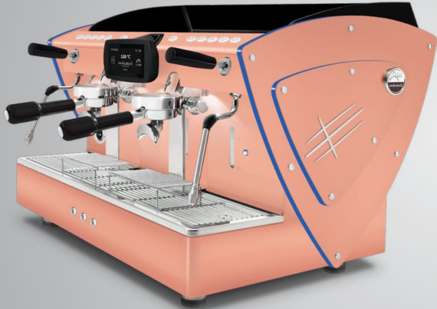
Toute blanche methacrylate bleu