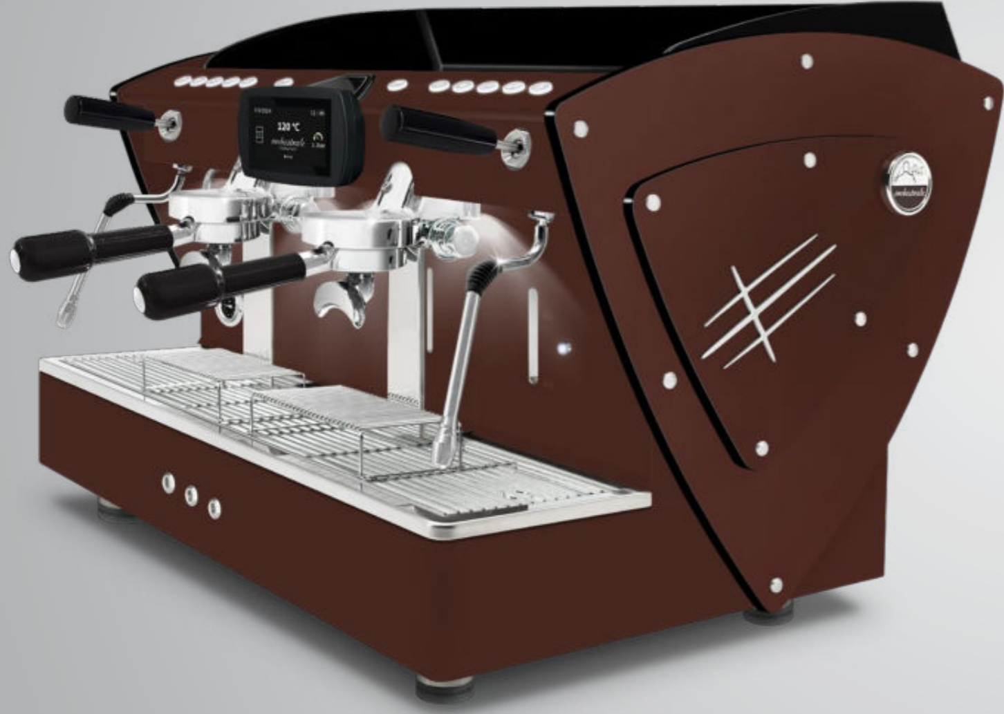
Toute marron rouille methacrylate noir