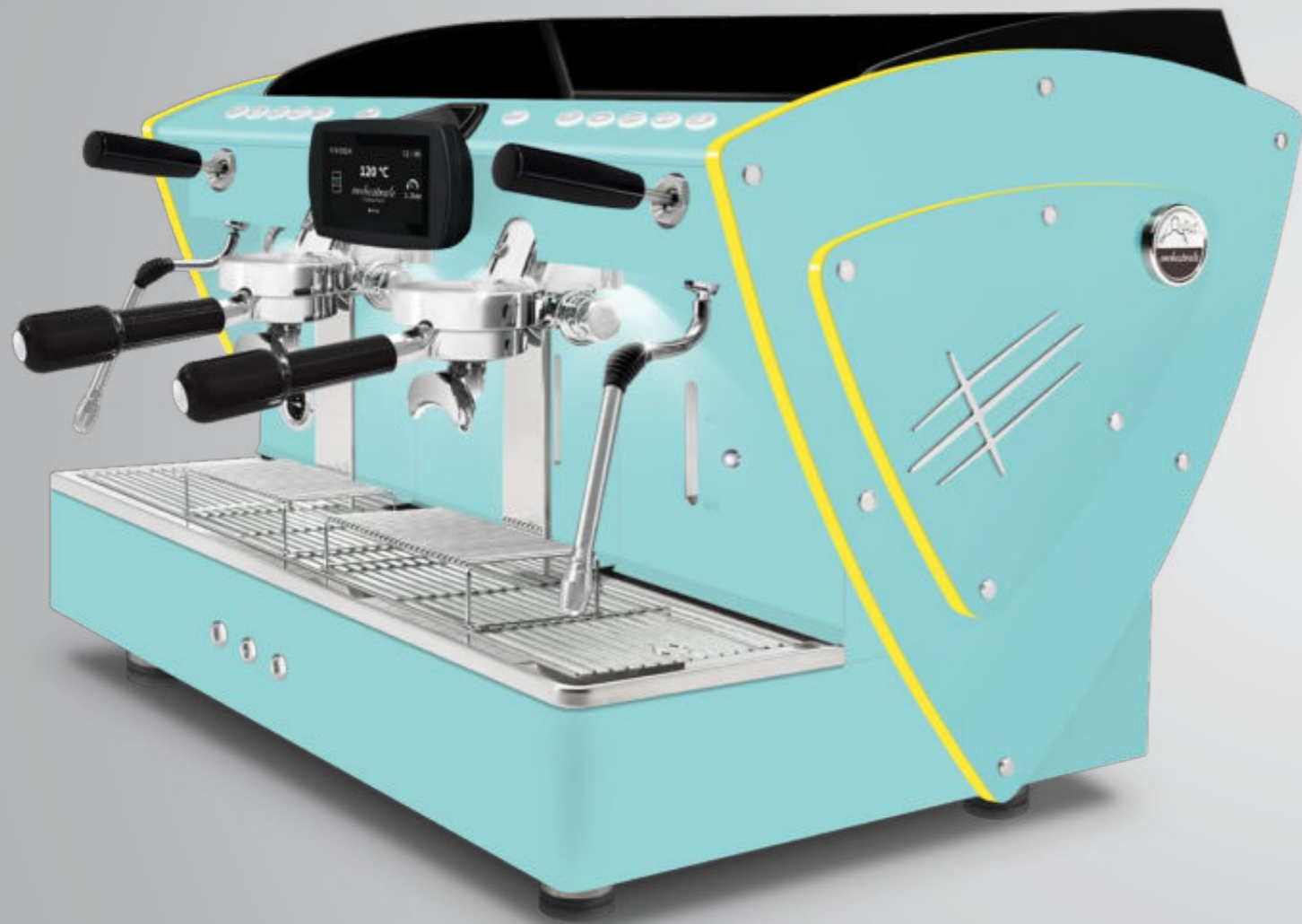
Toute bleu Tiffany methacrylate jaune