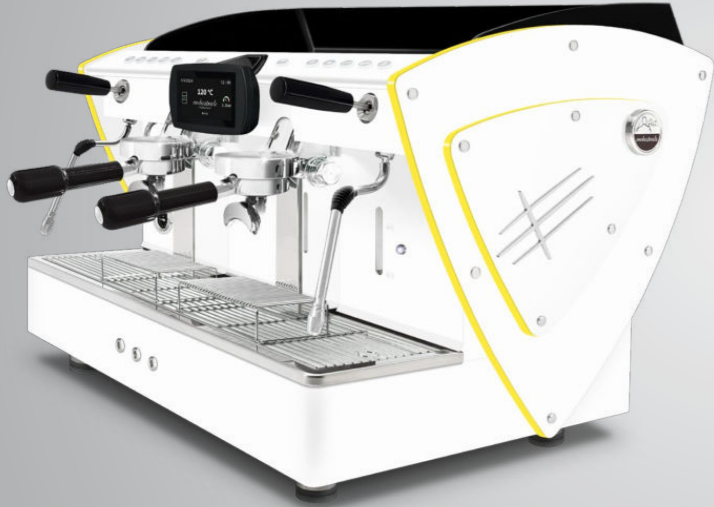
Toute blanche methacrylate jaune