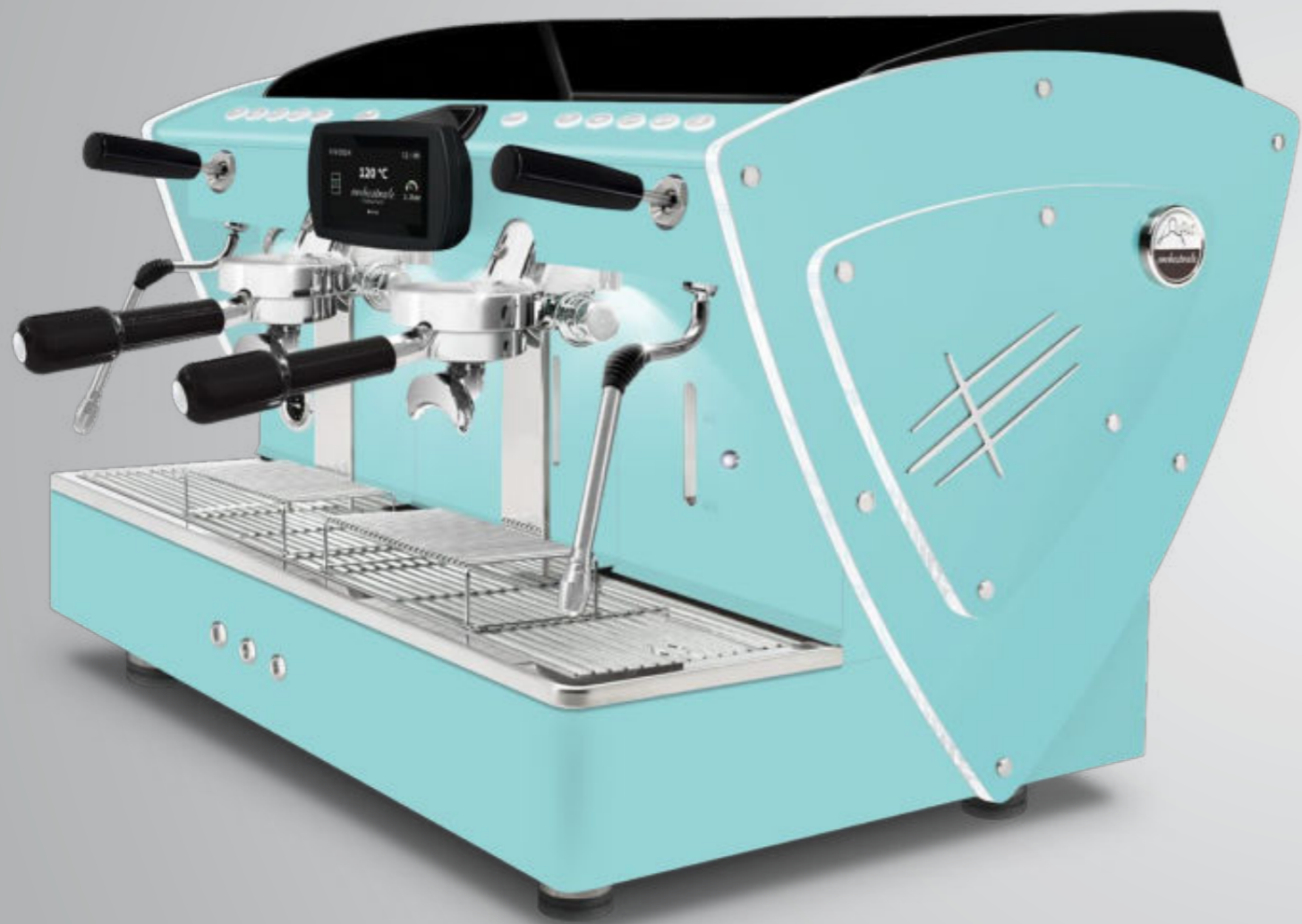
Toute bleu Tiffany methacrylate transparent