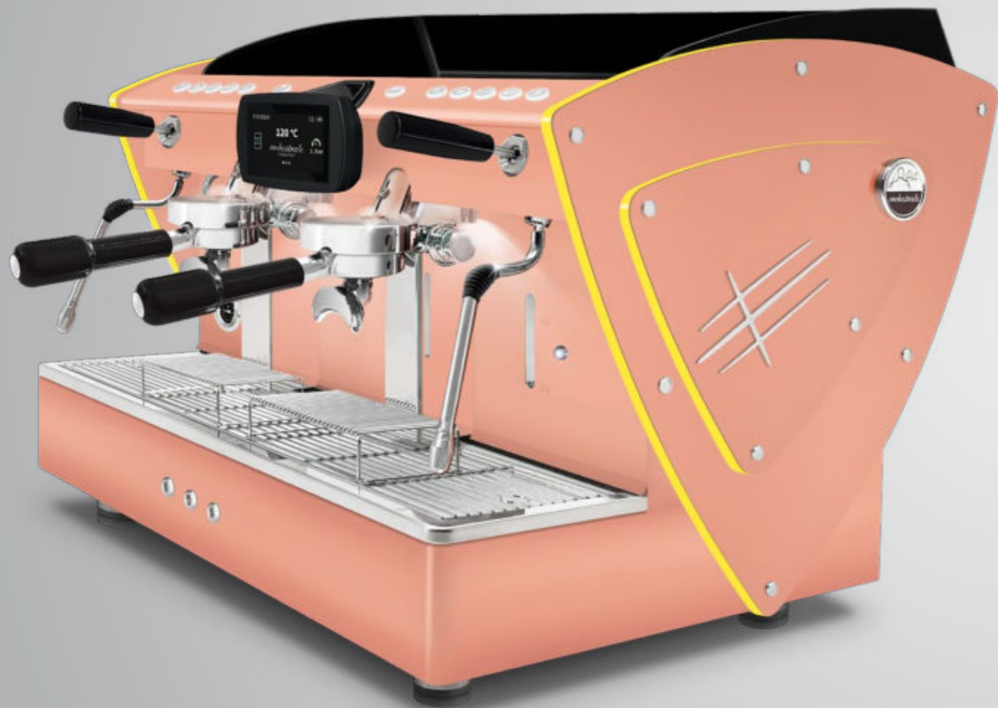
Toute blanche methacrylate jaune