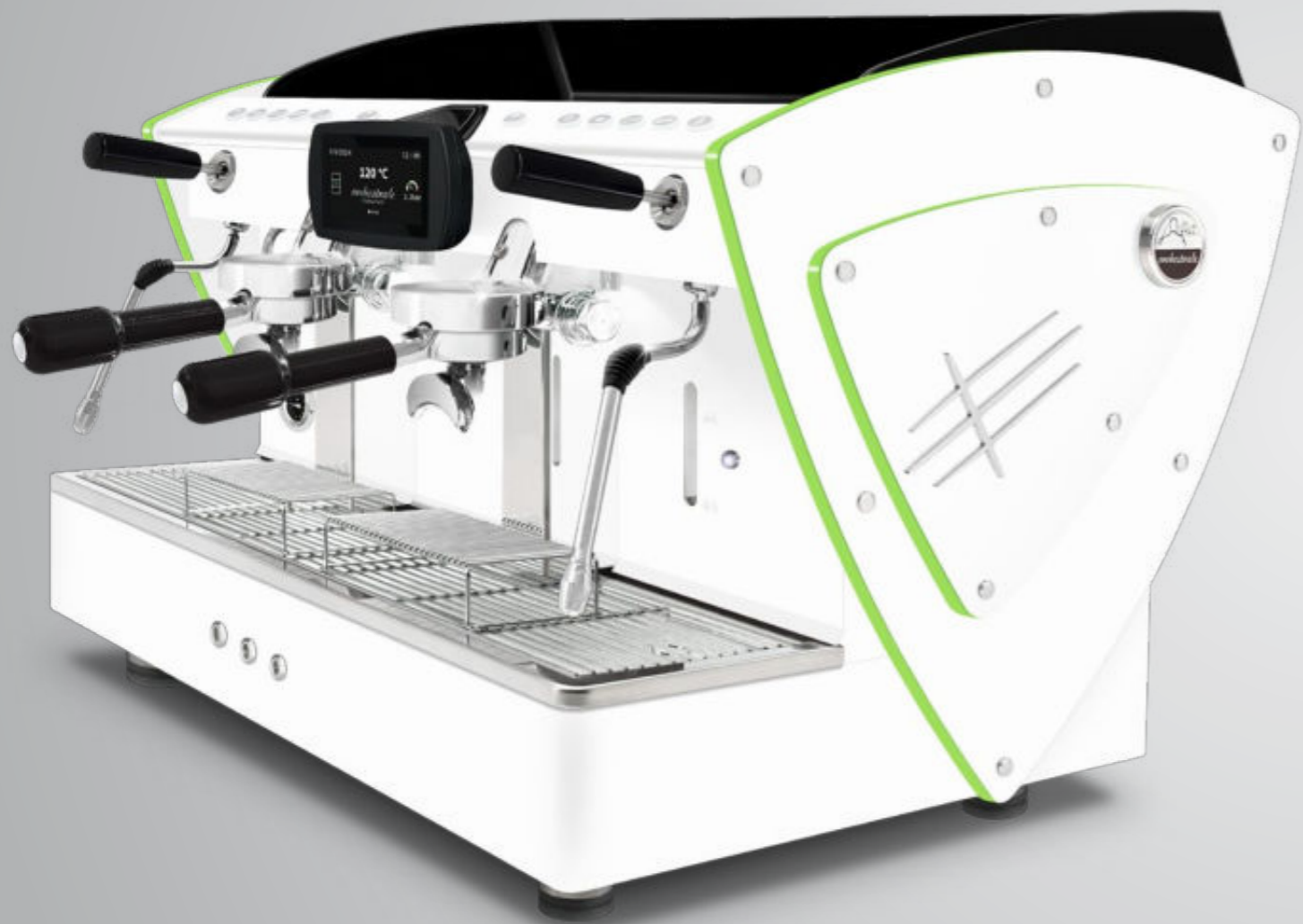
Toute blanche methacrylate vert